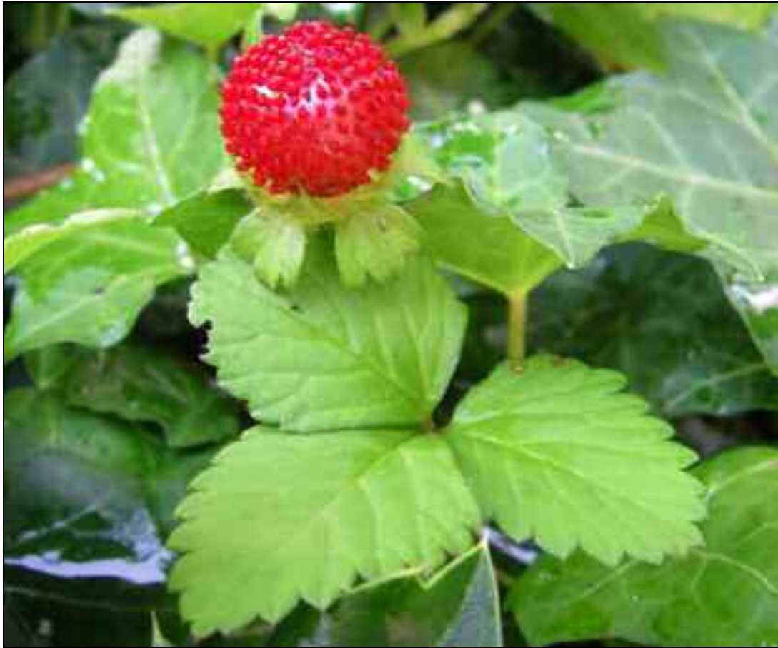
Figure 1. – Duchesnea indica.