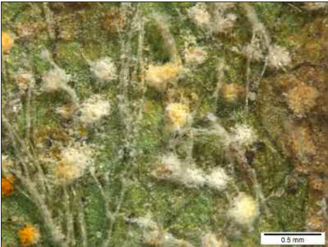
Figure 6. – La moisissure Lecanicillium muscarium sur les urédies de Frommeëlla mexicana (spécimen A. Fraiture 3070).