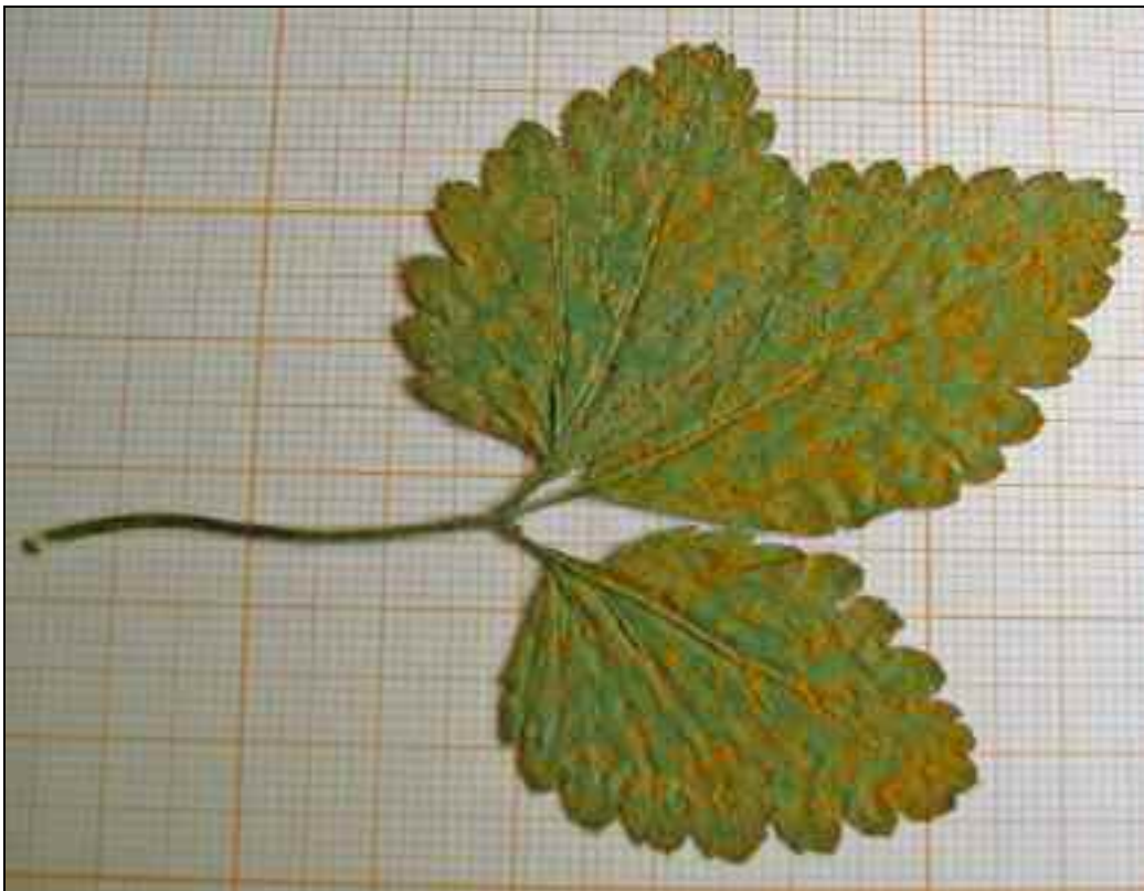
Figure 2. – Frommeëlla mexicana , urédies à la face inférieure d'une feuille de Duchesnea indica (spécimen A. Fraiture 3068).