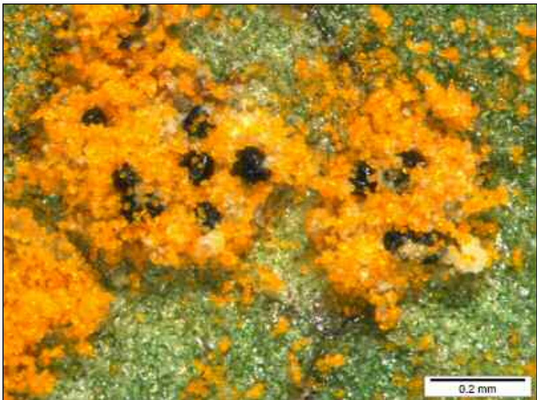
Figure 4. – Eudarluca caricis , pycnides du stade anamorphique ( Sphaerellopsis filum ) dans les urédies de Frommeëlla mexicana (spécimen A. Fraiture 3068).