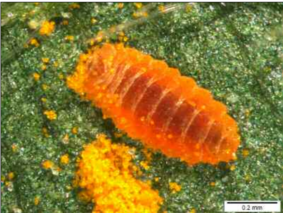
Figure 7. – Larve du diptère Mycodiplosis sp. (photo D. Ertz, spécimen A. Vanderweyen F 560).