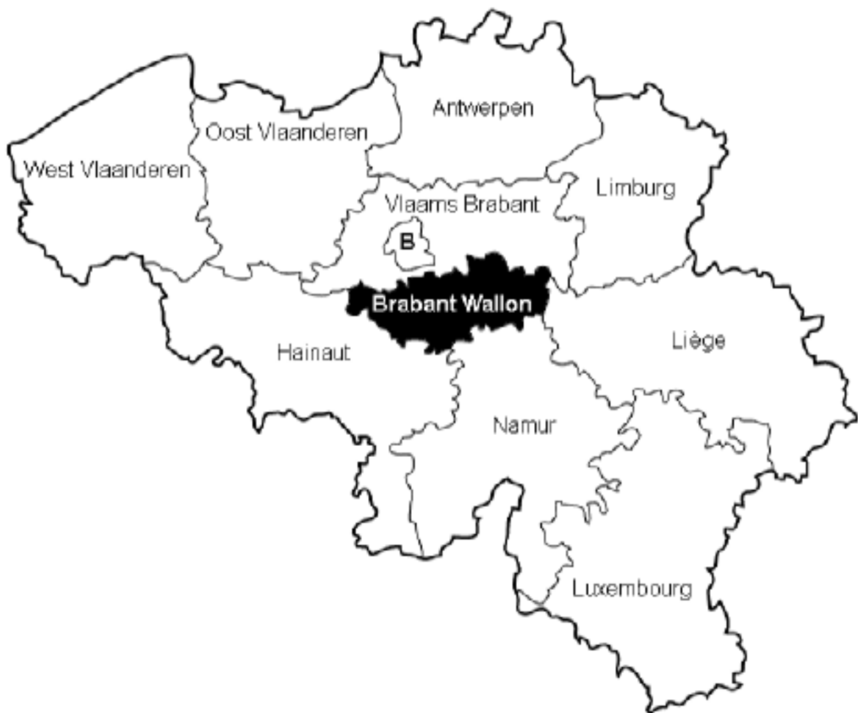
Figure 1. – Les 10 provinces de Belgique.

Belgique, avec seulement 1090 km 2 . Elle comprend 27 communes. La densité de la population y est relativement élevée et est la deuxième de Wallonie avec 336 habitants par km 2 , juste derrière le Hainaut (340 habitants par km 2 ). Le paysage est ouvert et vallonné, et la couverture forestière y est la plus faible de Wallonie, avec seulement 9% du territoire, ce qui équivaut environ à 100 km 2 (10.000 ha). A titre de comparaison, la province du Luxembourg s'étend sur 4440 km 2 , ne compte que 57 habitants par km 2 , et présente un taux de boisement de 51%.