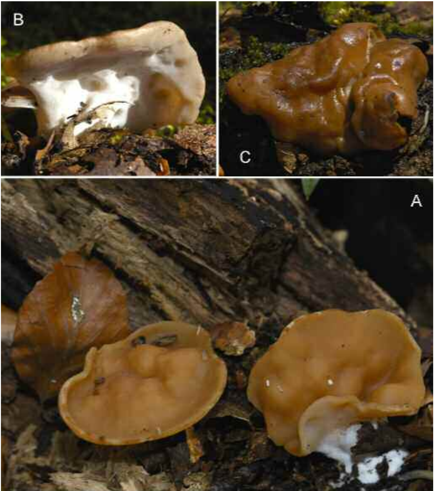
Figure 1. – Discina parma.