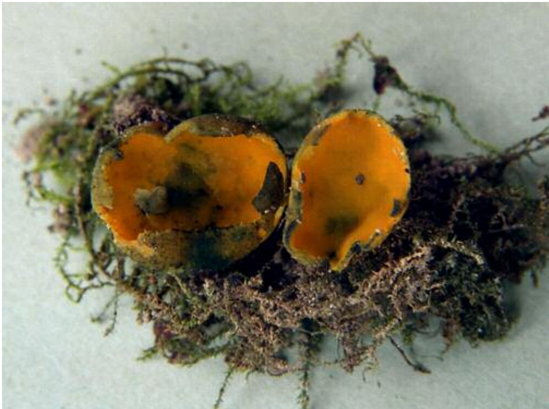
Photo 7. – Caloscypha fulgens , ascocarpes photographiés par Y. Deneyer à Saint-Symphorien, en avril 1997 (photo extraite de Ghyselinck & Deneyer 1999).