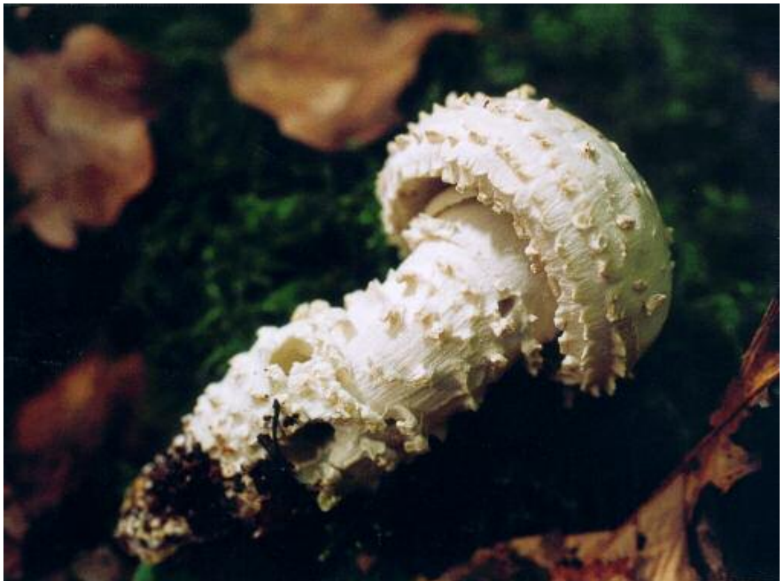
Photo 8. – Amanita vittadinii , jeune sporophore récolté par D. Ghyselinck à la Montagne-aux-Buis (Dourbes), le 17 octobre 1999.